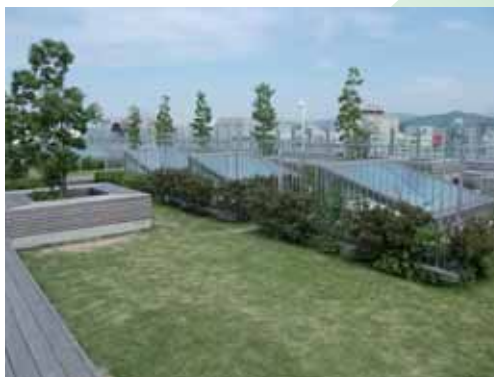
JR姫路駅ピオレビル屋上 緑化面積103㎡

イベント用の舞台が設置され、夏にはビアホールとしても活用されており、緑に触れながら楽しむことができる。