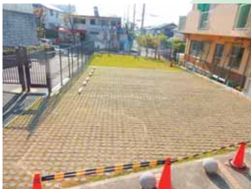
大原・桂木ふれあいの まちづくり協議会

アスファルト舗装の地温上昇軽減。イベント時には芝生広場と一体となるような、駐車スペース以外の活用も期待できる。