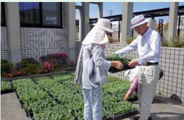
育苗に対する支援

しかし、近年では人口減少や高齢化が進み、総じて花緑団体の体力低下も心配されます。活動を継続・発展するためには、「人 ひと」「物 もの」「金 かね」「情報 じょうほう」そして「情熱 じょうねつ」が不可欠で、その課題を克服する方法