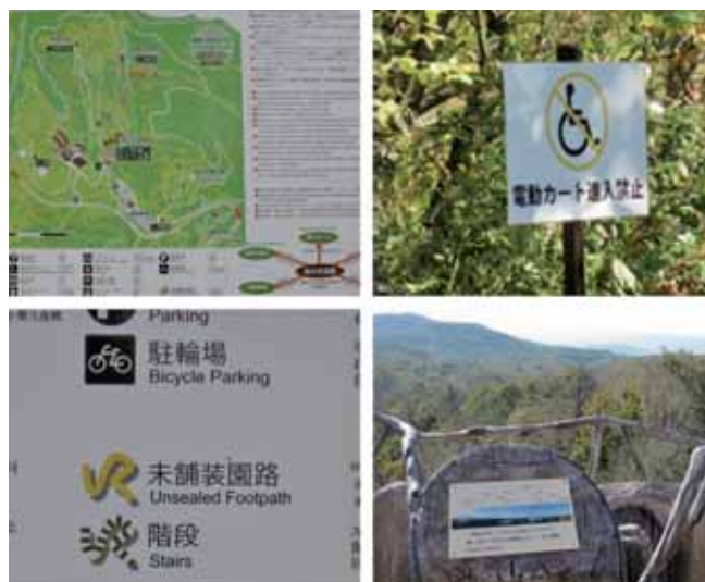
国営滝野すずらん丘陵公園でのバリアフリー情報提供

また、次の写真は東京都練馬区にある豊玉公園ですが、大規模改修に機会を併せ、設計前から障害当事者の参画を得ながら、その空間のあり方を検討、整備が行われています。このように、ユニバーサルデザインは空間のしつらえ以外の多くの要素を持ち、それを導く手法も規則にのっとるといった画一的なものではないことがわかります。今回から4回の連載では、この