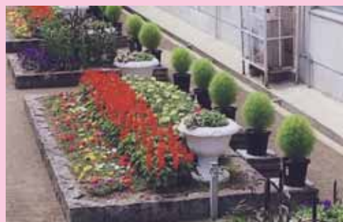
写真部門 兵庫県知事賞(最優秀賞)受賞作品