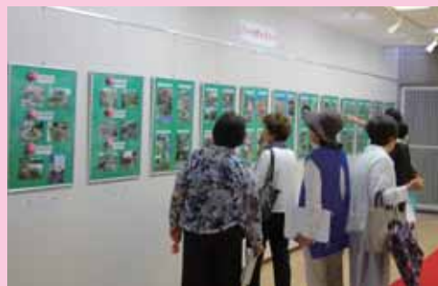
写真部門 展示風景