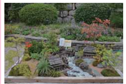
まちなみガーデン部門 兵庫県知事賞(最優秀賞)受賞作品