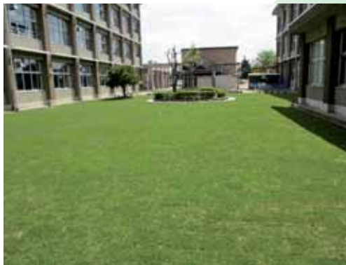
三木市立 広野小学校

校庭の芝は、順調に成育し、子供たちが早く駆け回ったり、お弁当を食べたりしたいと心待ちにしています。また、全校生徒集会等に使われます。