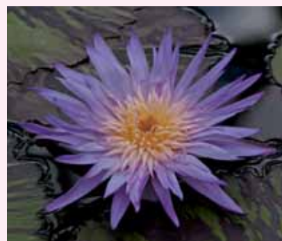
改良が進んだ熱帯性スイレン 'ファイヤーフォックス'