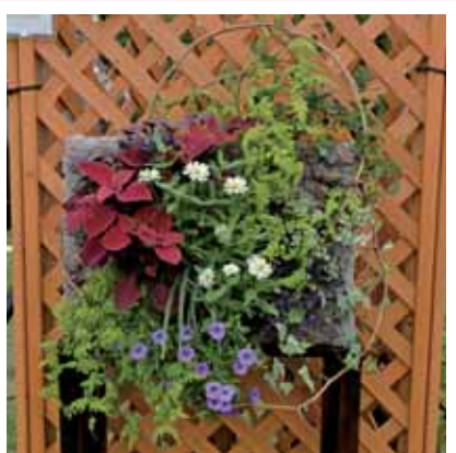
ハンギング・壁掛け、額縁型プランター部門 兵庫県知事賞(最優秀賞)受賞作品