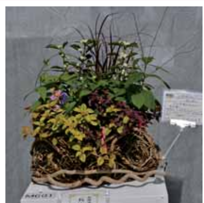
ミニ寄せ植え部門 兵庫県知事賞(最優秀賞)受賞作品