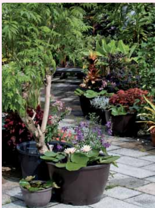
睡蓮鉢とコンテナ植えの草花を並べた「スイレンのある暮らし」