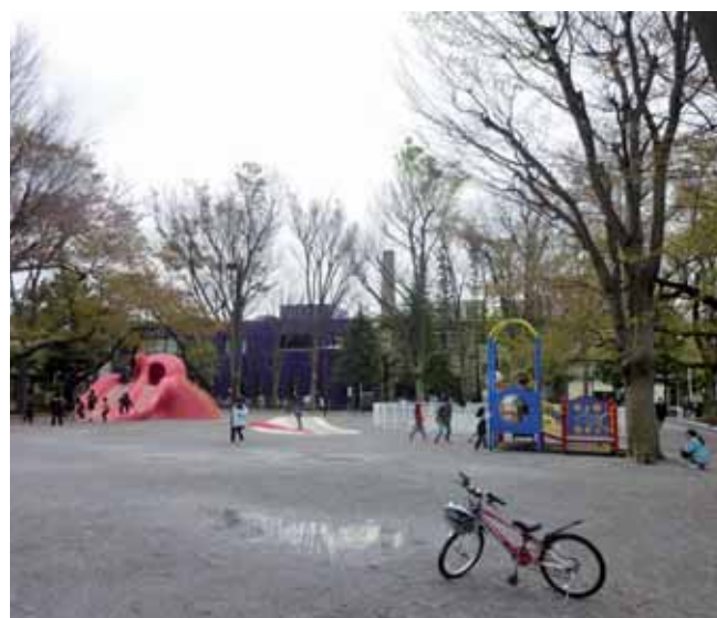
障害当事者参画により改修を行った練馬区豊玉公園

ユニバーサルデザインについて、特に花・緑と関係が深いと思われる事例やトピックを紹介していきたいと思えます。