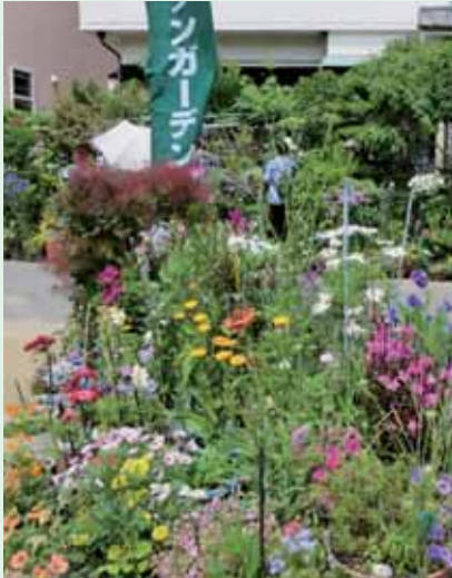
オープンガーデンの様子

今年も、県下各地で春期の花緑イベントやオープンガーデンなど多彩な活動が行われ県内外から多くの来訪者を迎えました。地方自治体主催のイベントだけでなく、県民主体の「花と緑のまちづくり活動団体」による様々な取り組みも大変多かったです。