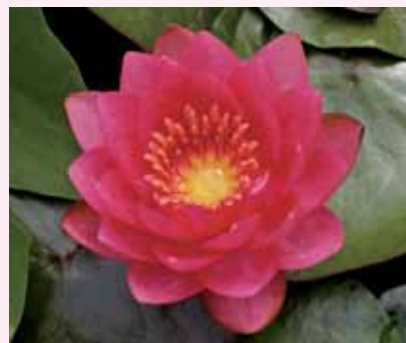
モネの池にも植えられたといわれる耐寒性スイレン 'ジェームズ・ブライドン'

耐寒性スイレンは寒さに強く、冬越しに工夫はいりませんが、暑さを好まないのので、暑くなると花を休む品種があります。一方、熱帯性種は、冬越しに工夫が必要ですが、暑さに強く夏中花を咲かせるため、現在人気が出て栽培する人が増えています。