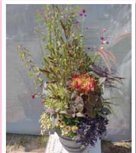
寄せ植え部門 兵庫県知事賞(最優秀賞)受賞作品