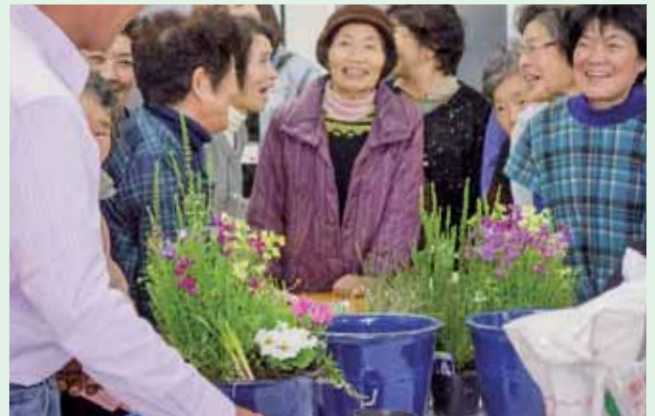
ネットワークが広がり活性化されます

現在は、兵庫県とそれぞれの花緑団体との相互関係で意見交換や様々な支援が行われています。しかし、担当職員は数年で人事異動することが多く、そのたびに信頼関係を築く期間が必要となれば、必ずしも持続的な支援を期待できる現状ではありません。中間支援団体は、行政、個人・企業など、資金、人材、情報等の資源提供者と個々の活動団体とを仲介し、NPO育成・運営等に関わるなど主にソフト面でサポートすることが主な役割で、まさに「扇のかなめ」の役割を担うものです。