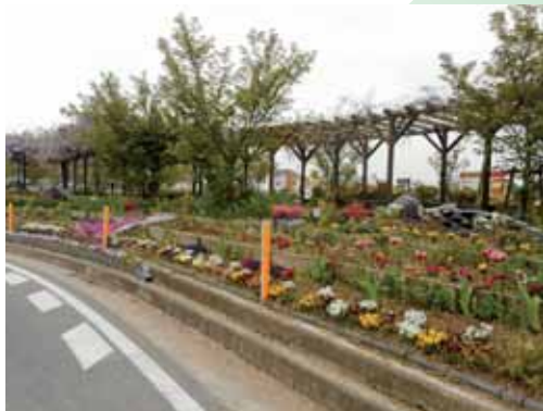
うすしおの郷 地域振興協議会

観光スポットにある市中公園に、地元の人が大事に育てたひな壇の花々と、今回植栽した花木が上手く調和し、公園の心地よさを倍増した。