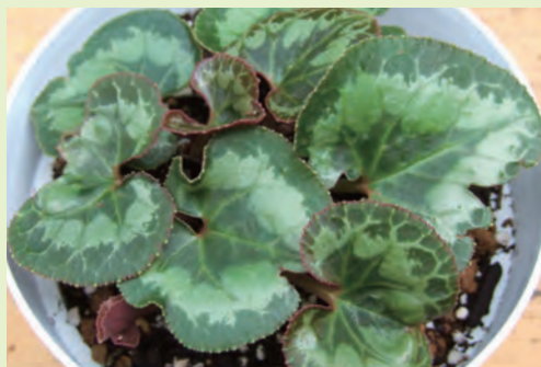
植え替え後のシクラメン 植え替え後2-3週間もすると大きな葉が展開し始める