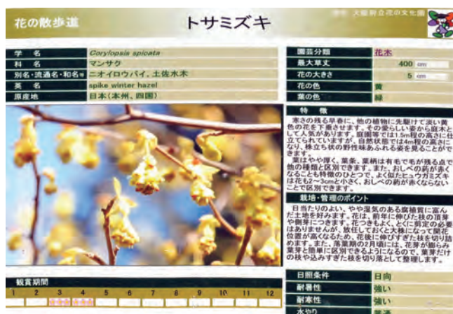
写真2 - 図鑑の1頁を思わせるラベル(花の文化園, 河内長野市)

上に紹介したキューガーデンでは、収集展示している植物個々についての情報が導入時点ですべて文書化され、データベースとして整理されています。そのようなデータベースがあれば、それぞれの植物の時々の様子を文章や写真で追記することが可能になります。