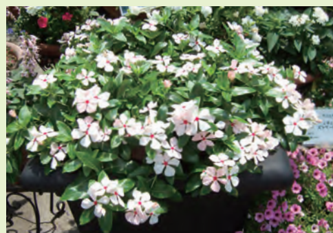
切り戻し後も元気に咲くニチニチソウ

肥料を施し、切り戻しや枝透かしを行います。肥料を控えていた株は施肥を再開します。ニチニチソウやインパチェンスのように初夏から咲き続ける草花は徒長した枝を切り戻します。強い切り戻しは避け、9月下旬までに全体の3分の2程度を残すようにします。ペチュニアやカリブラコアは日長が短くなると花芽を付けにくくなるので9月中旬以降の切り戻しは行わず、込み入った枝を間引く枝透かしを行うと良いでしょう。また、株内部の枯れた枝や葉だけでなく黄色くなりかけた葉も取り除くようにします。そうすることで風通しが良くなるとともに、光が当たり株を健全に保つことができます。