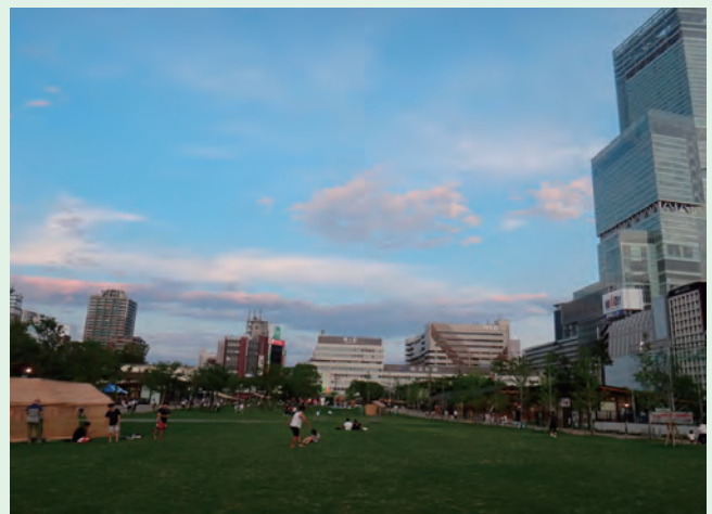
天王寺公園のエントランスエリア“てんしば”

いずれにしても、時代潮流の変化に反応し、公園利用者が満足するだけでなく、都市公園のもつ魅力を最大限引き出し、わが国最大の社会問題である地域再生や少子高齢化に都市公園が役立ってほしいと願うものであります。