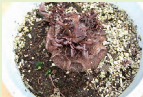
夏越ししたシクラメン 休眠法で夏越しさせた場合9月に入ると生長を開始する

植え替えの方法は、まず、鉢から静かに取り出し、根鉢の表面をほぐし取っておきます。鉢は2回り大きいか、球根の直径の3倍程度の大きさを選びます。用土は赤玉小粒6、腐葉土3、ピートモス1とし、元肥として緩効性肥料を規定量入れて混ぜ合わせます。球根は必ず土の表面から出して植え、鉢底から水が出る位たっぷり水やりを行います。植替え後1週間位は明るい日陰に置き、その後は日当たりの良い場所で管理します。大型種だけでなく、ガーデンシクラメンも、雨のかからない場所で管理する方が蕾も腐らず綺麗に咲きます。水やりの際も株になるべくかけないように行って下さい。