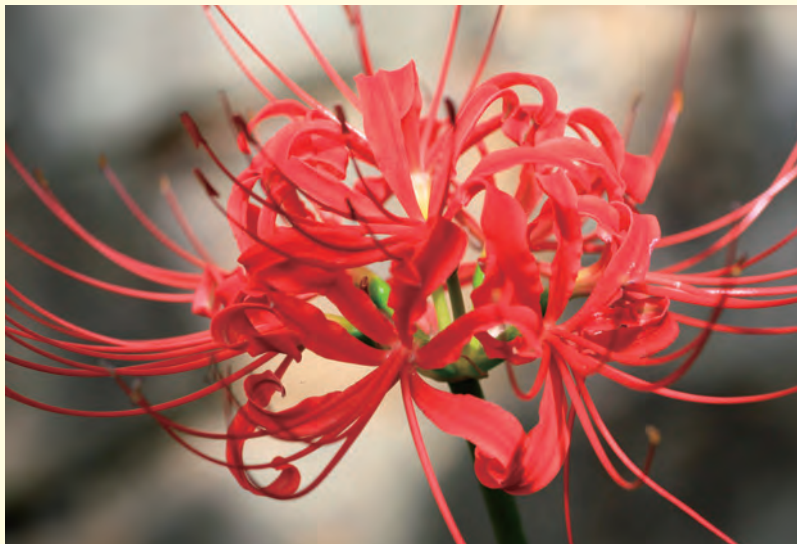
花言葉は、「情熱」「思うのはあなた一人」等

品種改良が進められ、何百という新しいものが生み出されており、リコリスという名前で、少しずつ人気も出てきました。