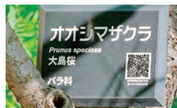
写真3 - QRコード付きのラベル(長居植物園, 大阪市)

その結果、生きた植物見本の追跡が可能になり、その植物の利用特性をよりリアルに理解できるのではないのでしょうか。見本園で見た植物を利用したいと考えた相談者は、QR