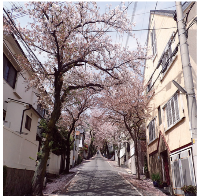
春に彩りを与えてくれる桜のトンネル(六甲ケーブル下)

①の都市アメニティとは、自然の少ない街なかであり、冬から春にかけて落葉樹は新しく葉が展開するとともに、常緑樹は5月から葉の更新が起こり我われに新しい季節の到来を告げてくれます。生き物が生息し、花が咲く、このような変化は、樹木が自然の摂理の中で行っていることですが、その効果を楽しむのは、道路利用者や沿道住民となります。また夏には、直射日光、路面温度の上昇や照り返し