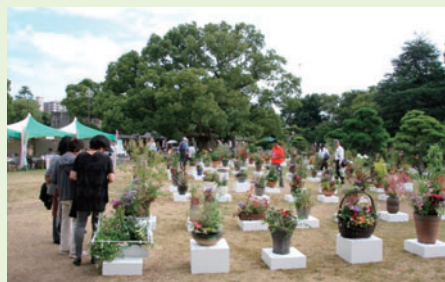
寄せ植え部門 展示風景