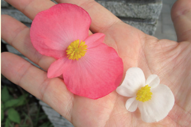
左：大型の新品種「ワッパー」 右：従来品種

ベゴニアには数多くの種類があり、木立性、根茎性、球根性ベゴニアに大きく分けられています。一般に我が国でベゴニアと呼ばれるものは、花壇に植えられるセンパーフローレンスで、四季咲きベゴニアとも呼ばれ、木立性ベゴニアに分類されています。花色の豊富さはペチュニアには及びませんが、葉が美しく、カラーリーフとしても大変有望です。また、最近では株だけでなく花も大きい、存在感のある品種が登場しました。