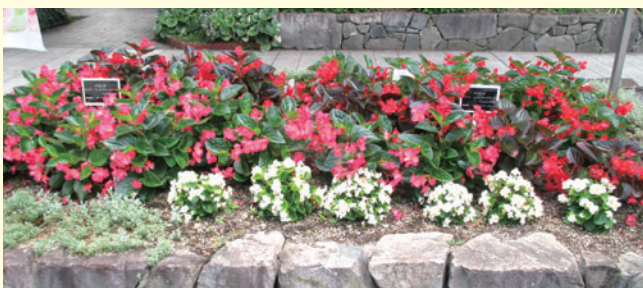
高低組み合わせると立体感のある花壇になる

株が大きいので大型コンテナに単独に植えると大変見応えがありますが、従来の矮性品種と組み合わせて花壇に植え込んでも、花壇に立体感が生まれます。平凡に見えがちなベゴニアですが、新しい品種も作出されており、その魅力を再認識することでしょう。