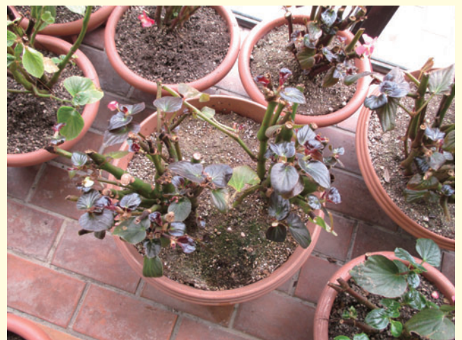
全体の1/3位まで地上部を切戻して冬越しさせる

ベゴニアは寒さに弱いため、一年草扱いになりますが、明石市のように海に近い市街地では屋外での越冬が可能です。ただし、今年の冬のように数年に一度訪れる厳しい寒さ(氷点下4度位)では枯れてしまうので、室内の凍らない場所で冬越しさせるほうがよいでしょう。