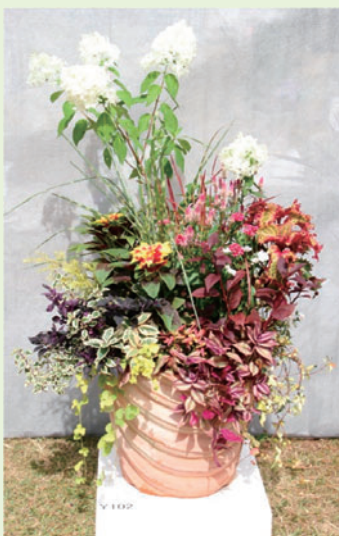
寄せ植え部門 2015年兵庫県知事賞(最優秀賞)受賞作品