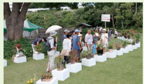
ミニ寄せ植え部門 展示風景