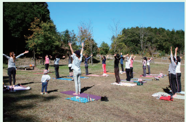
丹波並木道公園 あおぞらヨガ

公園は、緑豊かで安心・安全な空間であり、健康づくりの場として最適ではないでしょうか。ウォーキング、ジョギング、各種スポーツなど、公園それぞれの特徴を生かしたプログラムで体を動かしたり、公園での花壇づくり、除草・樹木管理等の維持管理作業、公園ガイドなどへのボランティアに参加したりすることは、健康づくりに効果的です。