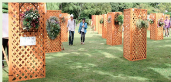
ハンギング・壁掛け、額縁型プランター部門 展示風景