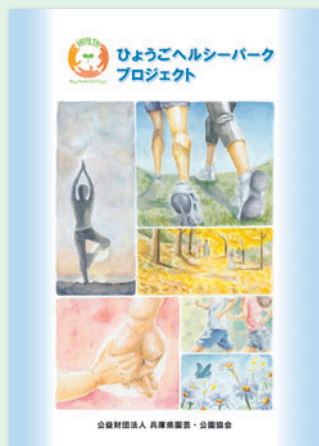
県立明石高等学校美術科生徒によるロゴマークと表紙

健康維持・促進の方法は多様です。県立都市公園を数多く管理運営する(公財)兵庫県園芸・公園協会では、公園を健康づくりの場として利活用するため、兵庫県健康財団や兵庫県健康福祉部局等と連携し、県民の健康増進に向けた新たな公園利用を促進する「ひょうごヘルシーパークプロジェクト」を展開しています。