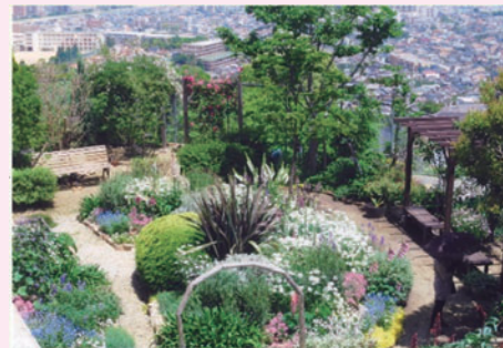
写真部門 2015年兵庫県知事賞(最優秀賞)受賞作品