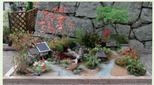
テーマガーデン部門 2015年兵庫県知事賞(最優秀賞)受賞作品