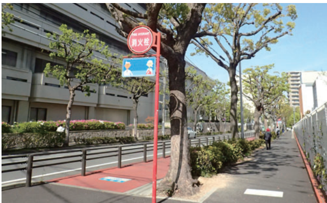
車道・自転車用道と歩道を分離する街路樹(神大付属病院南)

街路樹の歴史は古く、飛鳥時代には沿道に樹木が植えられ、奈良時代の都である平城京にはヤナギやタチバナが植えられたとされています。また、江戸時代になると街道にはマツやスギの並木が作られるとともに、1里(約4km)ごとに一里塚が造られ、そこには目印となるような樹木が植栽され、休憩場所として利用されるようになりました。そして近代に入り、街路樹の主な役割としては、①良好な都市アメニティ(生活環境)の形成、②沿道における都市景観の向上、③良好な道路交通環境の整備、という3つの大きな目的をもって植栽されてきました。