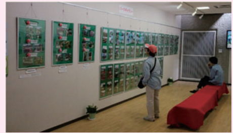
写真部門 展示風景