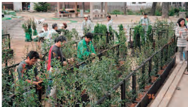
公園で移動生け垣を制作。

さらに第3段階の「まちに生垣を」で住宅周辺に生垣や庭を作ってもらうことを進めました。阪神大震災復興市民