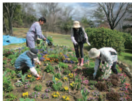
公園内の花壇の維持管理に精を出す