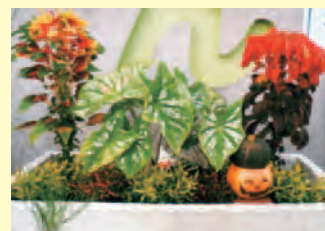
小野市立中番小学校 (小野市)