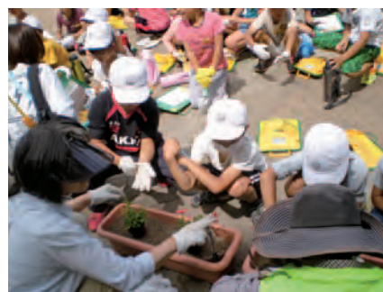
小学校の環境教育に協力