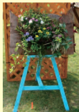
三木 初江 (たつの市)