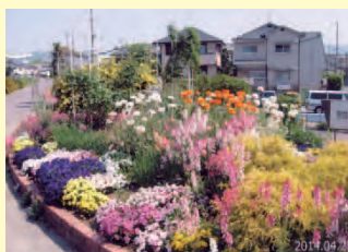
大池橋ミニバラ公園グループ (伊丹市)