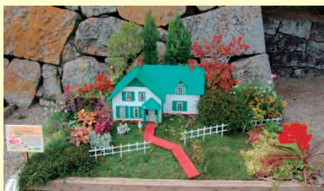
花と緑と志 (加古川市)