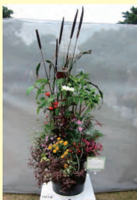
中村 郁重 (伊丹市)