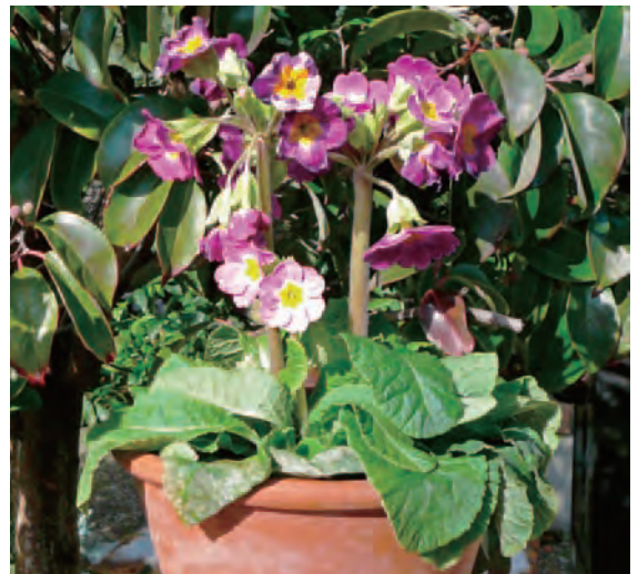
霜に当たった株(咲いた花は傷んでいる。)

なお、ジュリアンやポリアンは10月頃から花付きで流通していますが、これは高冷地で早く低温に当てて開花を早めているもので、夏越しさせても翌年同じ時期には咲かず、早くて年末からで本格的な開花は3月に入ってからとなります。