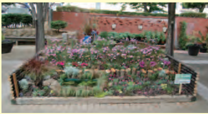
花と緑の学習園(上ヶ池公園)

ガーデンショーをより広範囲に楽しんでいただくために、明石市立花と緑の学習園、天文科学館～中崎遊園地の南北通りにサテライト会場を設けました。