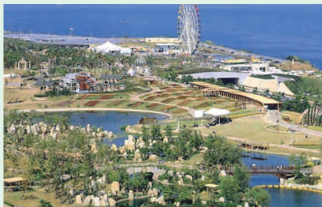
国際造園・園芸博覧会(ジャパンフローラ2000)は、2000/3.18~9.17、96ha、79カ国の参加、入場者695万人

アクションプログラムを策定しました。その後、企業庁による壮大な事業が進められ、現在の夢舞台の後背地に豊かな森が出現しました。