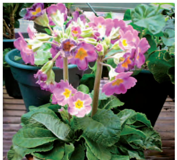
霜に当たった株その後 (霜の当たらない場所に移動すれば蕾はきれいに咲く。)