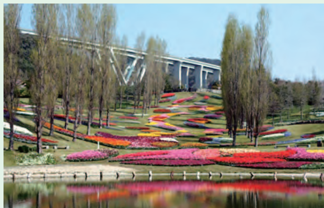
国営明石海峡公園 春のチューリップ

それと並行して、「兵庫県の美しい県土づくりに重要な人材養成のための、これまでにない新しい教育研究機関を創設したいと考えているので、検討すること!」との命が下りました。都市公園などハード整備も重要だが、すでに県下に数多くある公園や類似施設、さらに、花と緑あふれる美しいまちづくりを担う人材が不可欠で、こうしたソフトな施策も重要であるとの認識でした。この新しい教育研究機関が、今の兵庫県立大学専門職大学院緑環境景観マネジメント研究科(兵庫県立淡路景観園芸学校)です。しかし、検討さなかの平成7年1月17日、阪神・淡路大震災が起きました。筆者は、その時震災復興の膨大な財政支出の中、この学校構想は中止となるだろうと覚悟を決めたのです。(続く)