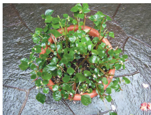
(写真2) 半分くらいまで切り戻した株