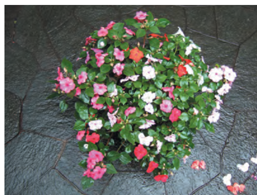
(写真1) 徒長して型が乱れた株

彼岸も過ぎると温度条件は良くなりますが、日差しは弱まり日の射す角度も低くなって日陰の場所が多くなってきます。日当たりの良い場所に移すと秋遅くまできれいに咲き続けます。軒下など霜の当たりにくい場所に置けば11月に入っても花を楽しむことができます。