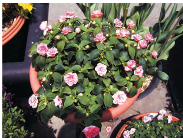
(写真3) 直射日光に6-7時間当たった株。(5月撮影) 直射日光に当たると葉がやや黄色みを帯びてくるが、この程度であれば花付きも良くなる。更に葉の色が薄くなってくると生育が鈍ってくるので日陰に移す。