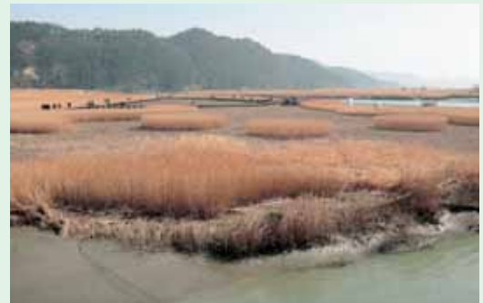
ラムサール条約に登録された順天市沿岸部の大湿地帯