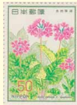
1978年に発行された自然保護シリーズの記念切手「サクラソウ」

避けて、涼しいところで管理しましょう。開花後、地表に根茎が出てくるので増し土をして覆います。夏には地上部が枯れ休眠期に入りますが、この間も水やりは必要で極端に乾かさないようにしましょう。植え替えは秋か早春に行います。丁寧に株分けをし、大きな芽を4本植えにするのが古くからの基本です。鉢は4~5号鉢程度の中深鉢を用います。江戸時代から伝えられ、サクラソウの可憐な花色を引き立てるといふ孫半土(まごはんど)の鉢は憧れですが、現在は入手困難になりました。丹波焼の鉢を愛用している方もあります。密かなこだわりが園芸の醍醐味です。