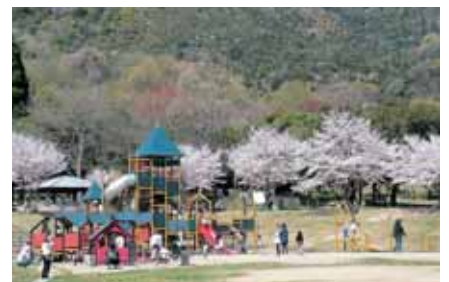
桜に彩られた芝生広場