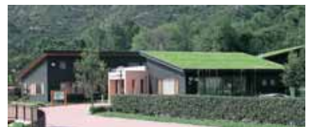
芝屋根を採用したみどりの相談所

問合先 市ノ池公園 みどりの相談所 〒676-0828 高砂市阿弥陀町地徳301 TEL 079-447-6401 FAX 079-447-6402 相談日時 平日 8時30分から17時15分まで 土・日・祝日 9時から17時まで 休館日 年末年始