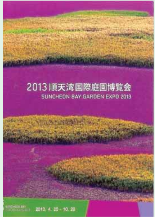
順天湾国際庭園博覧会のポスター

※2 水鳥を食物連鎖の頂点とする湿地の生態系を守る目的で1971年に制定された国際条約