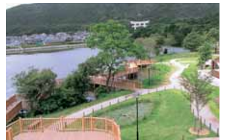
貴重な水生植物が自生する市ノ池