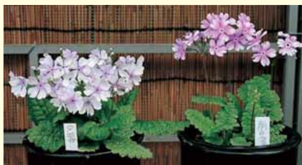
大阪市立長居植物園で展示されたニホンサクラソウ