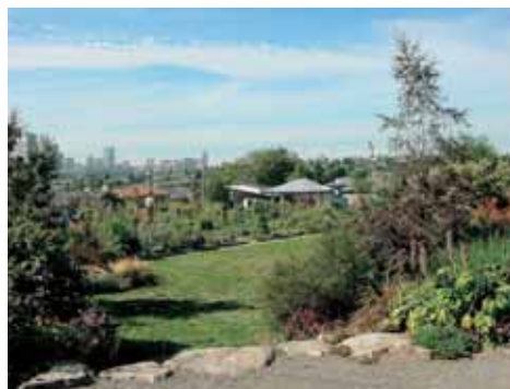
シアトル市のコミュニティガーデンと奥に広がる菜園

広場的なコミュニティガーデンから菜園を持つコミュニティガーデン（私は、それをコミュニティファームと呼んでいる）へ。消費大国米国が経済の成熟による時代の流れを受けて、収穫や食への関心、農業を取り巻く環境への配慮、ひいては景観に対する問題意識の高まりを受けて、今後益々コミュニティの中で農に対する取り組みは盛んになっていくと思う。地域の「農場」として、共同で取り組むコミュニティファームがこれから広がっていく予感がする。