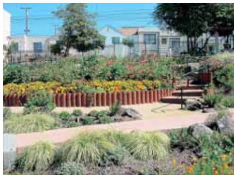
サンフランシスコのコミュニティガーデン

米国西海岸は元々先進的な市民活動が盛んな地域である。2004年に私が訪れたサンフランシスコの下町では、連続するブロックごとに5つのコミュニティガーデンが完成したところだった。下水道局の持っていた土地を公園部局に移管して、そこを地域住民がNPOと連携して活動していた。興味深かったのは、こうした手続きや行動に、目的の違う別々のNPOが関わっていたことである。NPOはそれぞれ、目的を明確にして活動している、という印象を受けた。当然のように、有償スタッフが中心となっている。