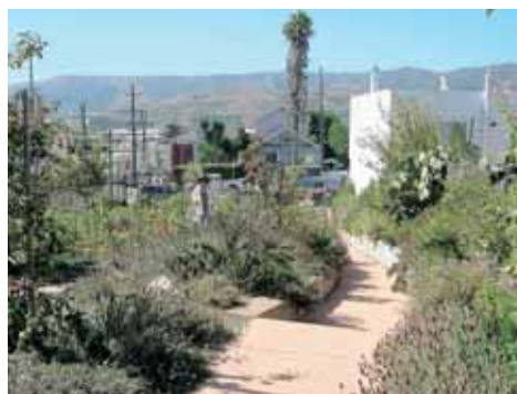
サンフランシスコのコミュニティガーデンの中の菜園

ぞれが個別に管理する分区園式のものもあれば、共同で野菜づくりをしているところもある。菜園活動は、多くのコミュニティガーデンの柱となっていた。市民が「農」や「食」に触れる場として、また交流や青少年の育成に寄与する場として、野菜づくりの空間は大いに活用されていた。