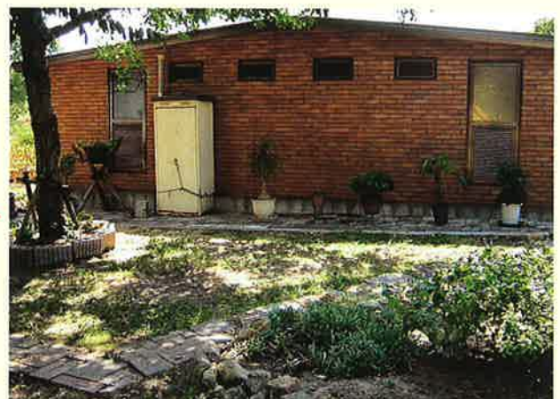
<整理・整頓後の管理地>