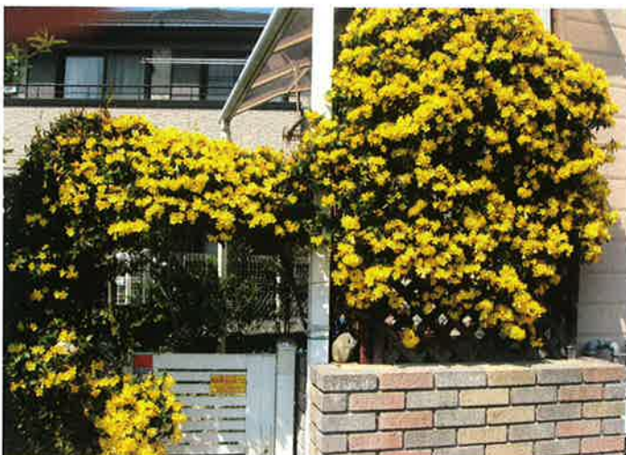
前庭を飾るカロライナジャスミン

次にツル性植物の利用があげられる。ツル性植物はフェンスや建造物、樹木の形に沿って誘引する。生育が旺盛になるといろいろな方向に伸長するので、生育期はこまめに誘引・整姿し、荒れて見えないように心掛ける。ツル性植物材料としては、ヘデラ、オオイタビ、ナツツタ、ピナンカヅラ、テイカカヅラなどがあげられる。また、花が観賞できるものとしてツルバラ、クレマチス、ハゴロモジャスミン、カロライナジャスミンなどがある。