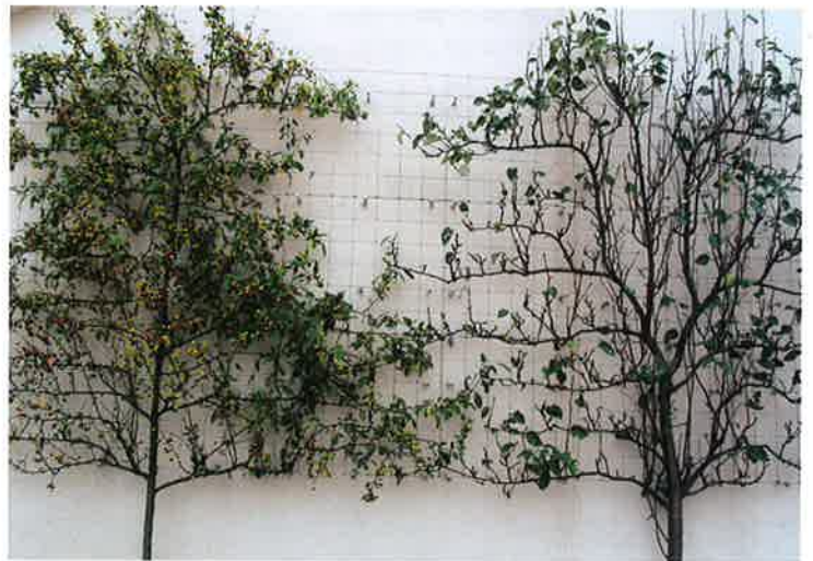
壁面に誘引したエスパリア

狭小住宅では、それぞれの家屋デザインや塀を至近距離で見せる結果となり、個性を演出した手法はそのまま意匠が突出して見える結果となる。建造物が目立つため勝手気ままなデザインが続くと乱雑な街並みとなる。このような街並みで、デザインの統一ルールがあれば調和のとれた街並みができる。景観条例や生垣助成などの制度がこの目的達成のために設定されている。あたりまえのことだが植栽デザインでまちなみの調和を図ることが大切であろう。調和を図るため、まず建造物の前に視覚的な緑量の確保を考えてみる。狭小地では樹木を育てづらく、それぞれの植物材料を至近距離で立体的に見せる手法が一つの解決策となる。幾つかの植栽手法があるが代表的なものを紹介する。