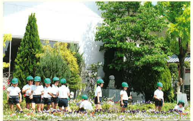
花と子どもたちのすばらしい出会い

「継続は力なり」と、花と緑のコンクールに20年余り応募を重ね、2009まちなみガーデンショーでの県知事賞のほか名誉花壇賞等数々の賞を頂いています。