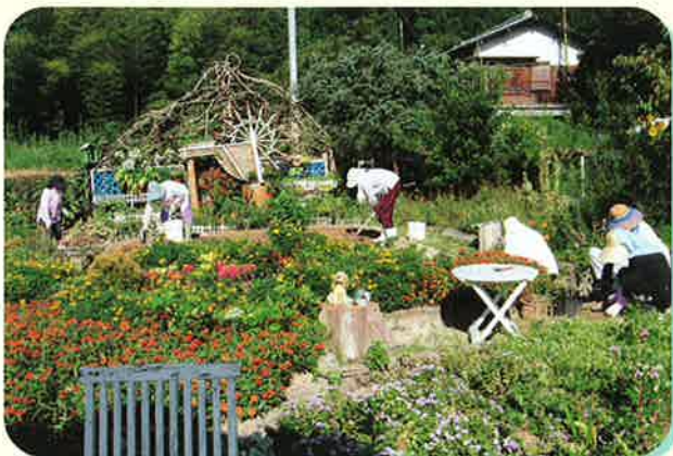
作業風景ーオブジェを背景にー

種や球根から育て、植え替え作業を皆で協力して行います。作業終了後はお客様とともにコーヒータイムを楽しんでいます。