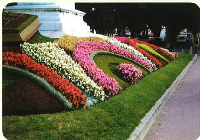
公共施設の模様花壇 ペゴニアの色違いの使い方ラインを強調している。 (ブルゴーニュ地方マコン市)

なっていること。2つは技術的なサポート、予算措置、育成保全、メンテナンス等行政側と住民側が一体となって取り組んでいること。3つは4ツ花を貰うとそれを維持していくためにヤル気が出てさらにグレートアップしていくこと等であります。またコミュニティ(市町村)にとっても観光産業及び花き園芸産業の発展という経済的効果も見過ごせないのです。