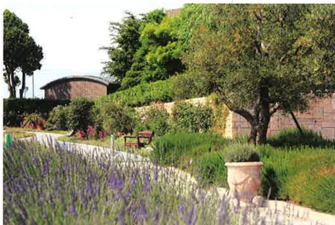
ハーブを利用したまちなみガーデニング