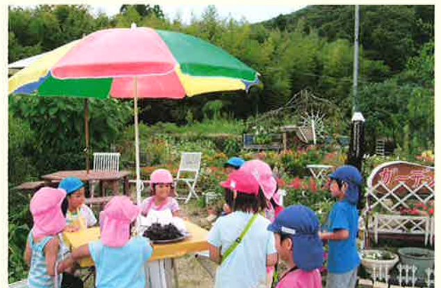
遠足で訪れた子どもたち。ちょっぴり緊張

より多くの方々に美しい花々を楽しんでもらうために、同窓会の二次会、老人会、婦人会、デイサービスの方を招いたり、保育園児や幼稚園児の遠足に利用してもらったりしています。自由ノートを置き、来訪者に感想を書いてもらい、花壇づくりの励みにしています。