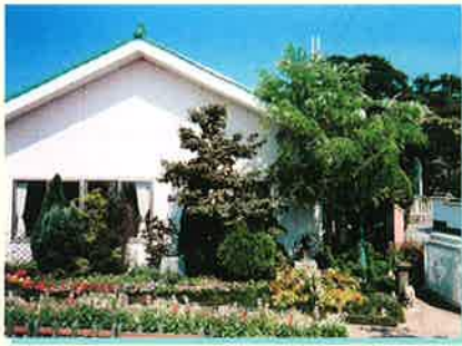
潤いと豊かさのある環境を作る

播種・定植・種採りを年2回のサイクルで春花や夏花を手作りで育てています。失敗もありますが、その成長に一喜一憂し、見事に咲いた花に拍手喝采です。パステルカラーを基調に濃淡色を配し、季節感豊かな花壇づくりを目ざしています。そして何よりも花に心を寄せ、花の命を大切に管理します。こうして育てた四季折々の花々が咲く園庭で子どもたちは花とすばらしい出会いをします。