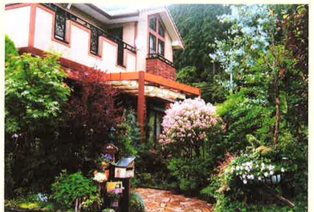
花木と手づくり作品のハーモニー

「2009ひょうごまちなみガーデンショー」出展の額縁プランター2作は、廃棄処分寸前の障子の棧を利用して額とイーゼルを作り、ペイントし、オルゴールを取り付けました。まさに「花に音楽を!!」です。曲は「千の風になって」と「世界に一つだけの花」です。嬉しくて何度も聞き返しています。花も人も活き活きです。是非お試しください。