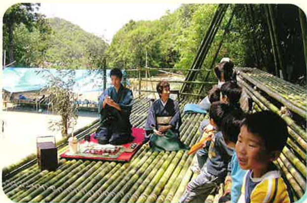
里山基地での「天空茶会」

まず地域の子どもたちと南あわじ市うずしおライン近くに「里山基地」を作り、私たちの活動拠点にしています。そこは湧水と竹林、春には山桜、コバノミツバツツジが群生する山々に囲まれ、時間が止まったような空間です。竹を組んで高さ十数メートルのツリーハウスを作り、そこから天空回廊を巡らせています。