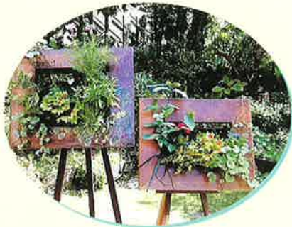
2009まちなみガーデンショー 最優秀明石市長賞受賞の額縁型プランター

は積雪80cm程になることがありますが、宿根草中心の庭は春に元気に芽吹いてくれます。いつの頃からか春になると庭を見に来られる方が年々