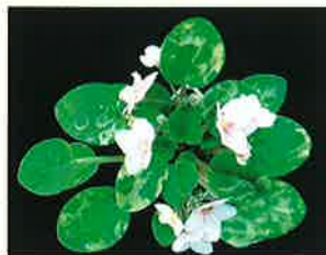
リングスポット症状

A セントポーリアは、東アフリカのタンザニアで原種のイオナンタが発見され、その後多くの種類が、タンザニア北部とケニア南部、標高1900mの高地から30mの低地において次々と発見され、これらの交配により1万品種を超える多くの品種が作出されています。園芸品種の大半は、人間の快適温度とされている20~24℃が生育適温で、10℃以下の低温、28℃以上の高温が苦手です。とくに冬の低温期にはワーデアンケースなどで保温するか、発泡スチロールの箱に夜だけ封入して保温します。また、灌水に使用する水は、湯などを加え、20℃程度の温度にします。水温が低いとお尋ねのような斑点が葉に現れ、美観を損ねます。これは生理的な障害でリングスポットと呼んでいます。