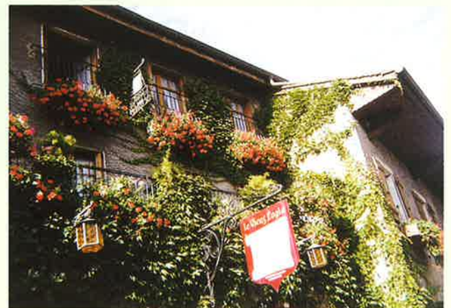
レマン湖畔イボアール村の住宅街 アイビーゼラニウムとツル性植物の組合せが 花をより引き立てている。

しかし日本に先んじること30年、フランスですでに花のまちなみコンクールをスタートさせ、花マーク評価基準に従って全国レベルで1～4ツ花を与える制度を定着させました。この花のまちなみづくりが発展したのは次の3つが大きな要因となっています。1つは4ツ花制度が景観に対する意識を向上させる大きな動機となり、街と住民の大きな誇りと