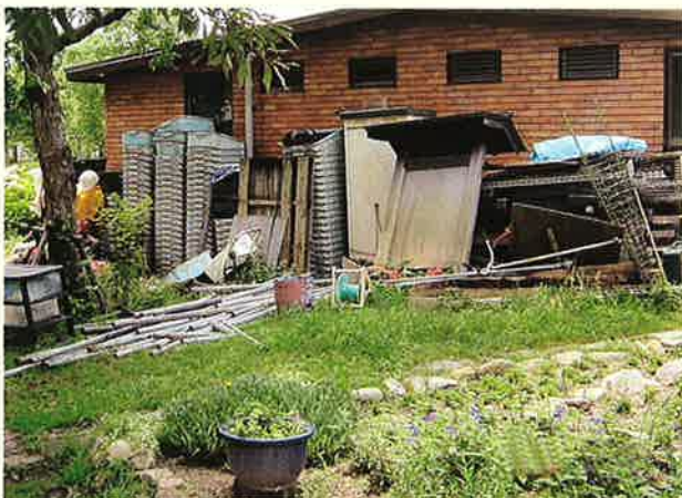
<整理・整頓前の管理地>

※地域住民団体などが、身近な公共空間である公園や街路樹・花壇などの世話を地域コミュニティ形成の場として活用していく神戸市の制度