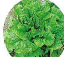
Fカッティング型 (チマサンチュ)