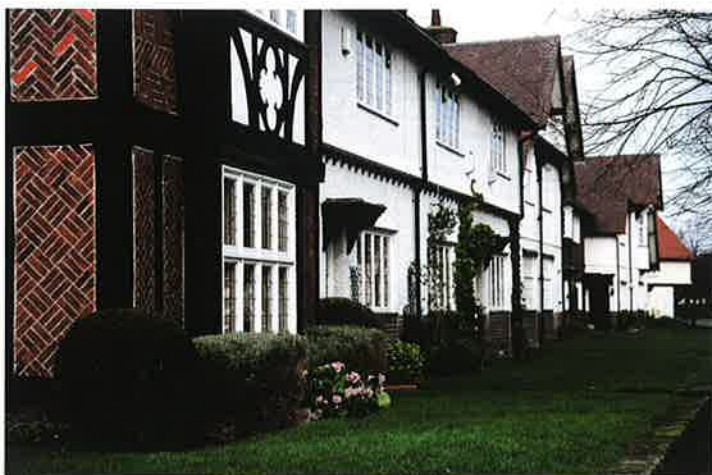
社宅では芝生が統一感を見せるポートサンライト村(イギリス)

具体的な例としてだが、外の少し離れた場所から家を眺め、家とバランスのとれた樹木やつる性植物を配置する。足元には芝生やリュウノヒゲが植えられ、さらに樹木と芝の間に低木や草花が彩りを添える。