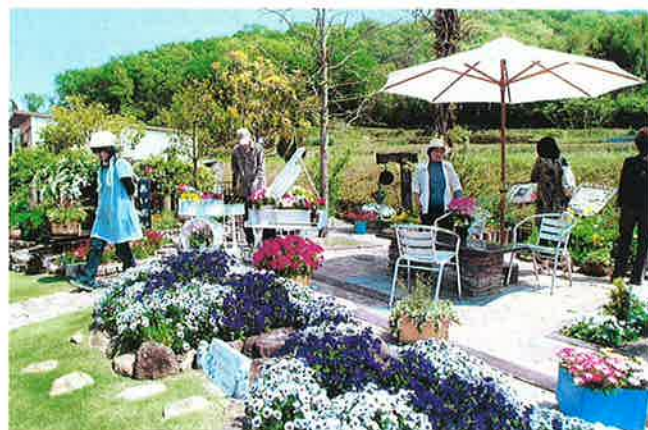
2009まちなみガーデンショーAIOI

日に、景勝地万葉の岬にあるつばき園（35品種、250本のツバキが植樹されています。）において「つばきまつり」を開催し、多くの来園者にその魅力を紹介しました。