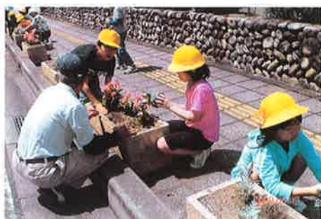
駅前の植栽活動 一子どもたちと共に

99年より地元の久下小学校が地域での体験学習の一環として活動に参加。駅前の県道約300mに並んだ約80個のプランターに、5月にはペゴニアなど約400本、12月には葉ボタンやパンジー約400本を植栽しています。