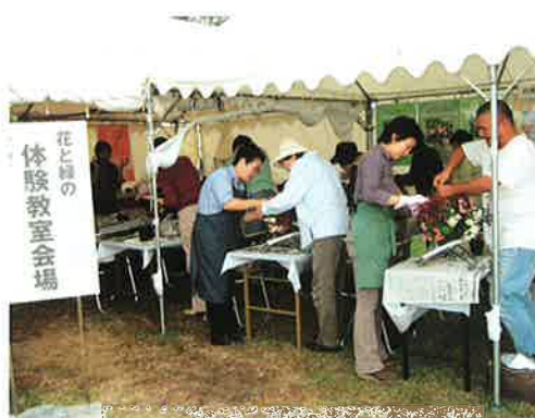
ひょうごまちなみガーデンショー体験教室

園芸先進国である英国のRHSの制度に倣って、ハンギングバスケットマスター（略称マスター）の資格認定