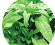
Eステム型 (ヤマクラゲ)