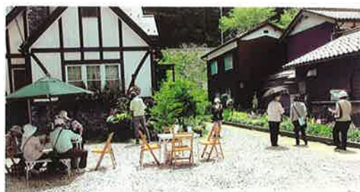
オープンガーデンの見学風景

「せめて我が庭だけでも見てもらおう」と「訓谷オープンガーデンの会」として再出発して4年目になります。