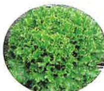
Cリーフ型 (フリンジグリーン)