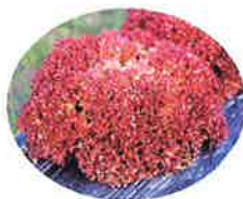
Bリーフ型 (ロコロッサ)