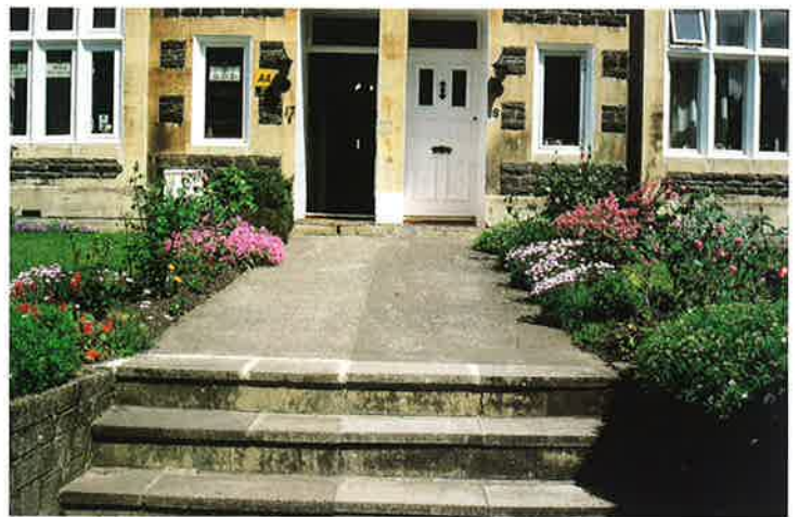
玄関までのアプローチは草花が両端を彩るバース市(イギリス)

前庭front gardenはイギリスから始まった庭の様式で、最近はわが国でも広がりを見せている。定義をすれば「家屋の前の通りに面した庭」となるが、公共空間である道路に面した場所は、たとえ個人所有の敷地であっても公共性を持たせることが望ましいという考え方が基底にある。イギリスの前庭は塀が多く日本の状態に近い。19世紀のアメリカで、さらに町全体の景観がピクチャレスク（絵画的、牧歌的etc.）になるように道路には街路樹を植え、前庭は極力広い芝生地とし、視覚的に隣地と連続させて、広い空間に家屋が点在するように町づくりを行う手法が確立している。