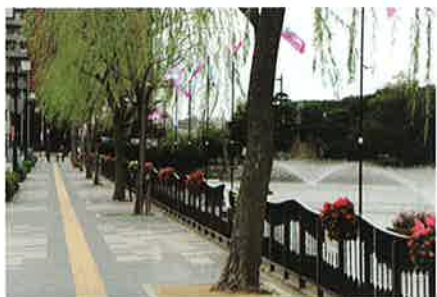
ガーデンショーの会場装飾（支部協力）

そうした中、より一層の普及を目的として、また優れた指導者や技術者を養成する組織として、英国王立園芸協会日本支部（略称RHSJ）の支援のもと1996年3月に日本ハンギングバスケット協会（略称JHBS）が発足しました。2007年には兵庫県支部もスタートしました。