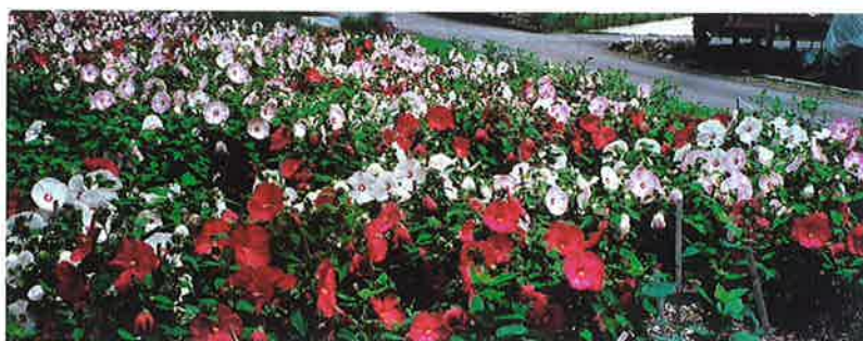
休耕田に咲くアメリカフヨウ

99年より地元の久下小学校が地域での体験学習の一環として活動に参加。駅前の県道約300mに並んだ約80個のプランターに、5月にはペゴニアなど約400本、12月には葉ボタンやパンジー約400本を植栽しています。