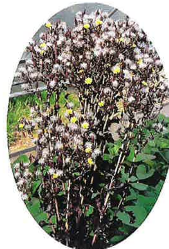
レタスの開花結実