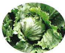
Aクリスピーヘッド型